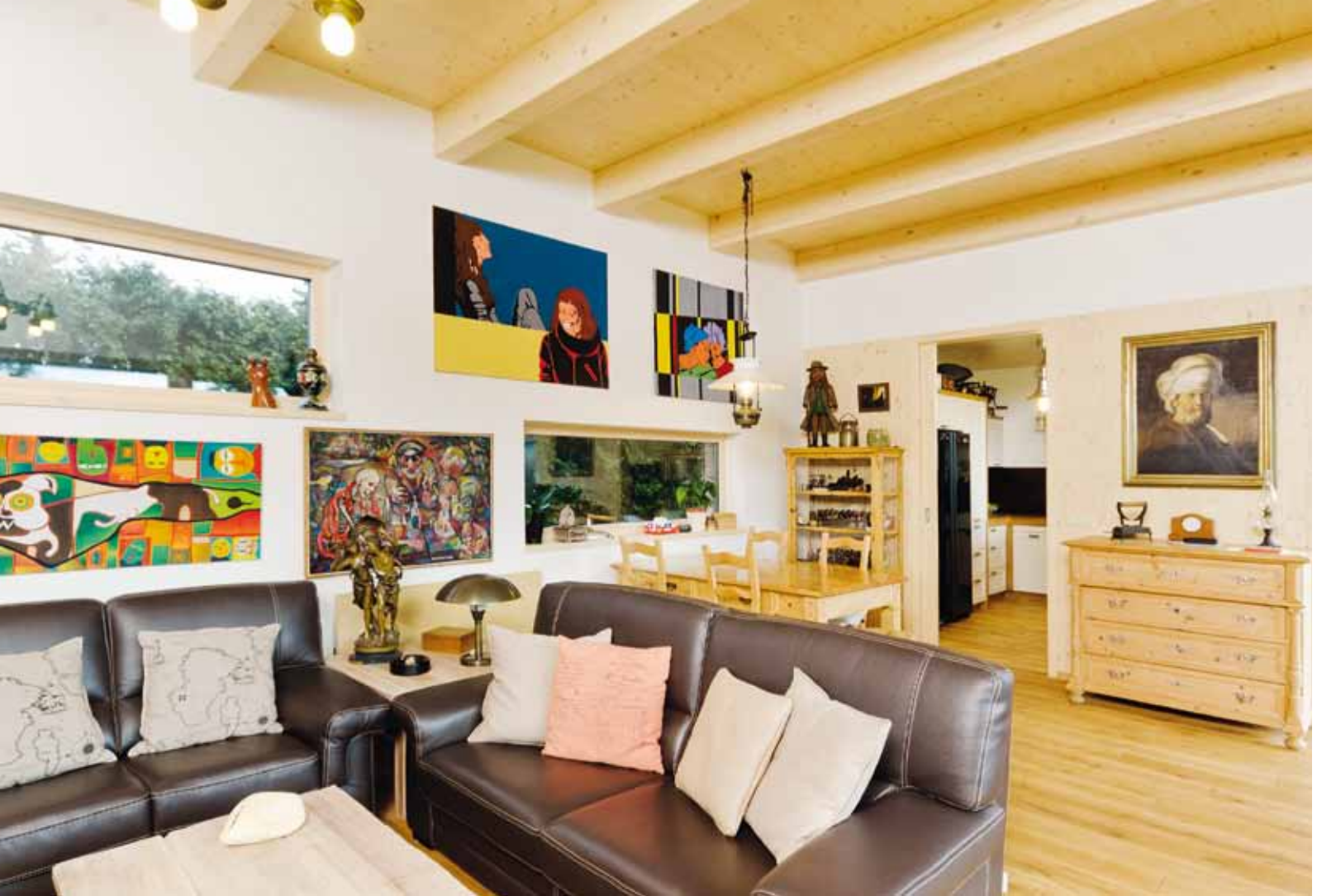
Podlaha z přírodního dřeva a strop s příznanými trámy a smrkovými prkny dávají interiéru mírně rustikální ráz. Obrazy korespondují s horizontálním oknem a zvýšeným stropem