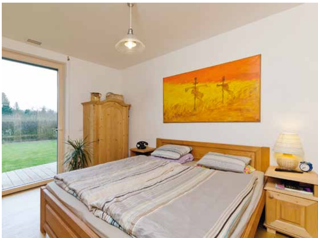
Ložnice je vybavena bytelným nábytkem z přírodního dřeva a velkým oknem přímo spojená s terasou a zahradou

S ekonomickým a pohodlným užíváním domu souvisí i zvolený konstrukční materiál. Stavba z třívrstevných lepených dřevěných panelů zateplená dřevovláknitou izolací se blíží pasivnímu standardu. Pro skvěle