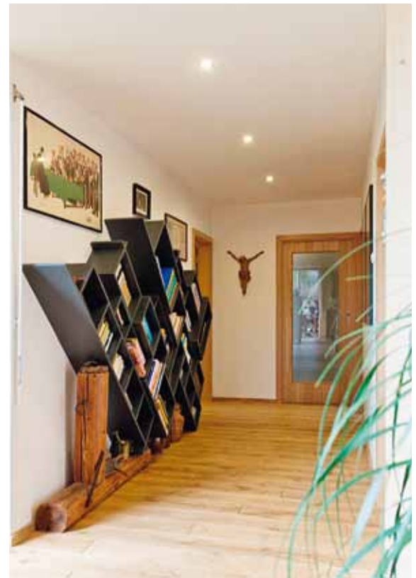
Převahu přírodního dřeva vyvažují výtvarná díla a zajímavé nábytkové solitéry, například „hroutící se“ knihovna